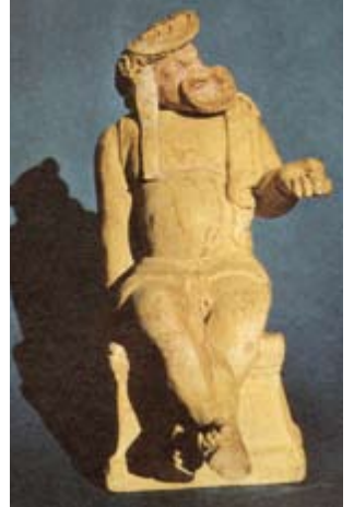
4. Terracotta beeldje van een scène uit een komedie: een slaaf die zijn toevlucht heeft genomen op een altaar (British Museum, Londen).

Een vergelijkbare ontwikkeling is te zien bij het genre van de komedie. Na de eerste experimenten (in dit geval bij Livius Andronicus, Naevius en Ennius) krijgt het genre in Rome een min of meer vastomlijnde vorm, waarbij de Griekse achtergronden duidelijk zichtbaar blijven. In de 21 bewaarde stukken van Plautus (circa 254-184), een eenvoudige handwerksman uit Midden-Italië, dragen de karakters Griekse namen en spelen de verhalen in Griekse steden. In alle openheid wordt vaak in de proloog vermeld op welk Grieks origineel een Latijns stuk teruggaat. Of zelfs: op welke originelen, want Plautus gebruikt graag contaminatio . Over zijn eigen rol is Plautus bescheiden, misschien ten onrechte. In zijn Trinummus heet het in vers 19, in een beroemde formule: 'Philemo schreef het verhaal, Plautus maakte de buitenlandse versie' ( Plautus uortit barbatae ). Intussen doet Plautus zeker meer dan omzetten naar de 'barbaarse' taal. Hij brengt Romeinse kleuring aan waar hij maar kan, met hele en halve Romeinse grappen, verwijzingen naar Romeinse feesten en gewoonten, en bovenal door een