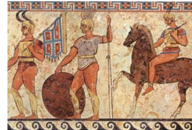
1. Samnitiëse krijgers op een schildering uit de 4de eeuw v.Chr. (Museo Archeologico Nazionale, Napels).

Rome, 241 v.Chr. De Eerste Punische Oorlog (264-241) is ten einde gegaan met een voor de Romeinen gunstig resultaat: een klinkende overwinning bij de Aegadische eilanden, even ten westen van Sicilië. Die zege levert Rome de heerschappij op over Sardinië en Sicilië. Het is de zoveelste militaire overwinning binnen enkele decennia voor de relatief jonge, maar snel groeiende Romeinse grootmacht. In een paar oorlogen zijn de taaie