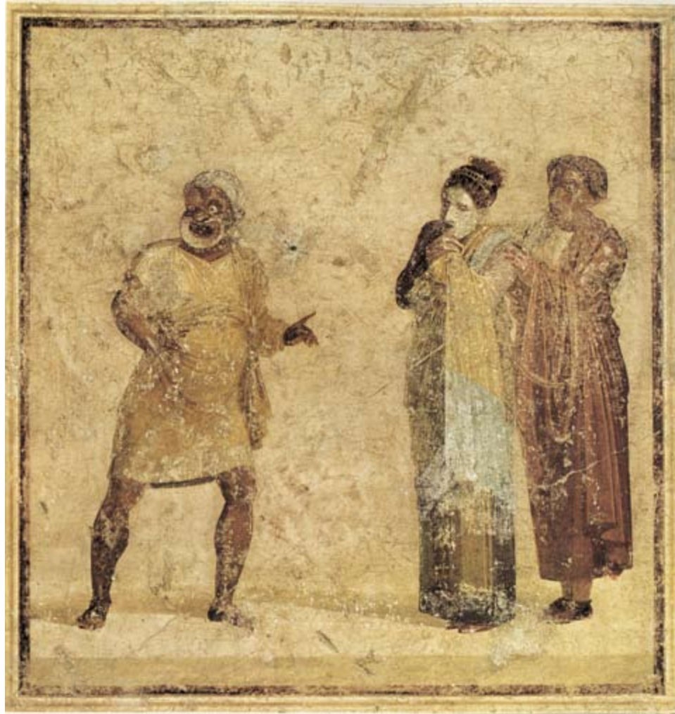
5. Scène uit een komedie. Muurschildering uit Pompeii (Museo Archeologico Nazionale, Napels).

exuberant, sprankelend Latijn, dat zijn gelijke in de Romeinse literatuur amper kent. Maar inhoudelijk en thematisch blijven zijn stukken toch dicht bij hun Griekse originelen.