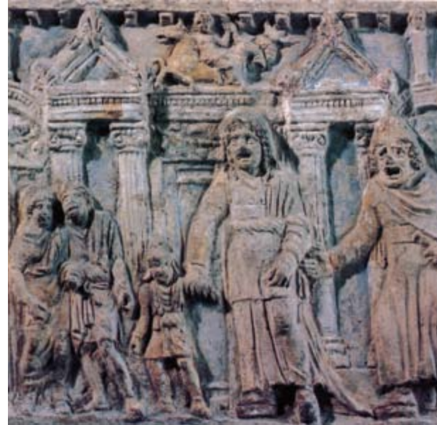
3. Een scène uit de tragedie Astyanax van de Romeinse dichter Accius (2de eeuw v.Chr.). Terracotta reliëf van een tombe uit de 1ste eeuw v.Chr. (Museo Nazionale delle Terme).

Men neemt algemeen aan dat Livius Andronicus rond 280 v.Chr. is geboren in de stad Tarentum, in Zuid-Italië. Kort na de Romeinse verovering van Tarentum in 272 werd hij naar Rome meegevoerd. De jonge Griekse slaaf kwam in huis bij een vooraanstaand heer die behoorde tot de familie van de