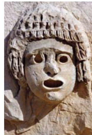
2. Tragediemasker, in situ in Myra (Zuid-Turkije).