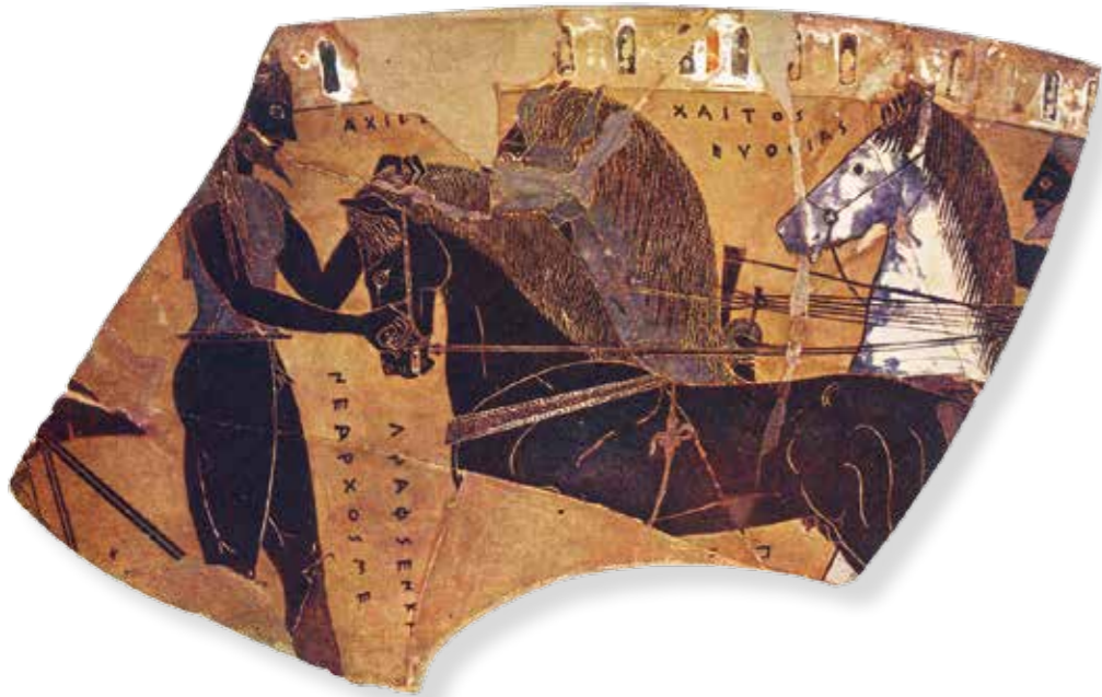
Op dit vaasfragment, in ca. 560 v. Chr. beschilderd door Nearchos, heten de onsterfelijke paarden van Achilles Chaitos en Eutheias (Nationaal Archeologisch Museum, Athene).

genaamd Podargus ( Ilias 23, 295). De naam 'Snelvoet' is misschien toch niet zo uniek als in eerste instantie leek... En die andere Griekse held, Achilles, bezit onsterfelijke paarden genaamd Xanthus en Balius, beide voortgebracht door de harpij Podarge, en een derde, sterfelijk paard met de naam Pedasus ( Ilias 16, 149-52). Minstens qua namen staan de homerische paarden nog stevig in de mythologische traditie. Ook hun eigenschappen lijken nog niet direct die van normale, historische paarden. Zo reageren Xanthus en Balius op de dood van Achilles' vriend Patroclus met geweën (Homerus gebruikt het gewone Griekse woord voor 'huilen') en weigeren koppig de strijd te hervatten. Dat laatste is aanleiding voor een homerische vergelijking van de paarden met een stèle op een graf. Pas als Zeus de onsterfelijke viervoeters toespreekt en hun moed inblaast doen ze weer mee ( Ilias 17, 426-58). Minder ontroerend, maar zeker zo bevreemdend is een scène kort daarna in het verhaal, waar Achilles door Xanthus zijn dood krijgt voorspeld. Het dier komt zelfs aan het woord en spreekt niet minder dan tien volle hexameters tot zijn meester ( Ilias 19, 408-17). Met de realiteit hebben Achilles' paarden uiteindelijk niet veel van doen.