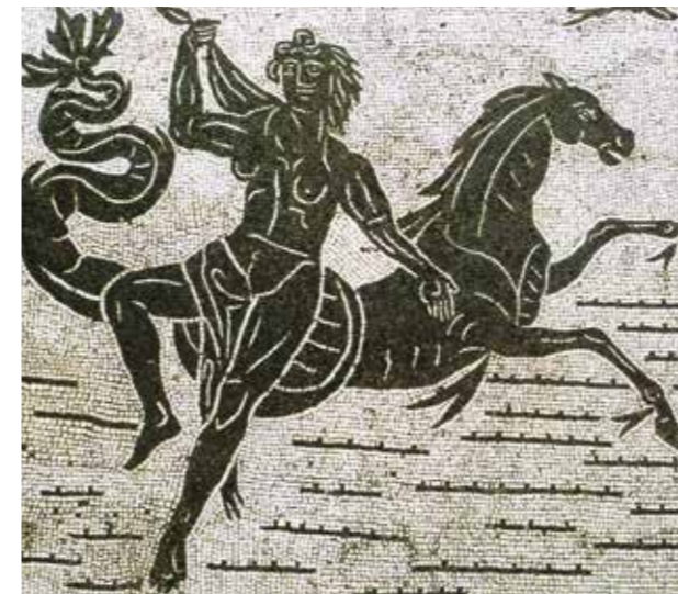
Een hippocampus op de mozaïkvloer van de Baden van Neptunus in Ostia.

Niet alleen met de hemel, ook met de zee zijn paarden verbonden. Zo is er Arion, een bliksemsnel paard dat een zoon is van Poseidon en Demeter (de zeegod had zich tijdens een erotische escapade tijdelijk veranderd in een viervoeter)