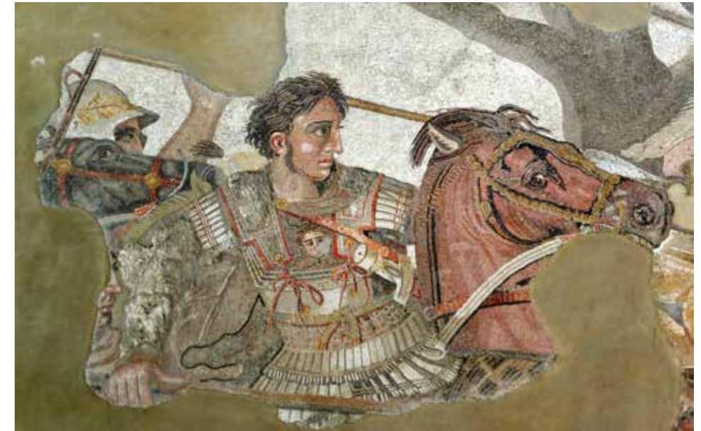
Alexander op zijn paard Bucephalus tijdens de slag bij Issus (333 v.Chr.). Detail van het Alexandermozaïek uit Pompeii. Het is een kopie van een origineel uit de 4de eeuw v.Chr. (Museo Archeologico Nazionale, Napels).

Zo is Alexanders paard ook door de beschrijvers van zijn daden welbewust vereeuwigd.