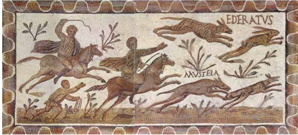
Jacht te paard op een Romeins mozaïek (Bardo Museum, Tunis).

'Borysthenes de Scythiër, keizerlijk jachtpaard, dat altijd over water en moerassen en Etruskische heuvels placht te vliegen, achter Pannonische zwijnen aan – geen zwijn met witte tand durfde hem, wanneer hij achter- volgde kwaad te doen, hij bespatte zelfs het puntje van de staart met schuim zoals zo vaak gebeurt – nee, met ongebroken jeugd en ongeschonden leden, op zijn tijd gestorven, is hij in dit land gelegen.' (Hadrianus, Gedicht 4 , vert. Vincent Hunink)