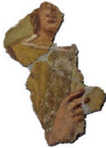
Fragment van een fresco uit de Romeinse villa in Maasbracht. We zien een man in een typisch Romeinse tunica met clavi.

Tot nu toe hebben we gekeken naar de kleding die de Romeinen in Italië droegen. Bestuurders, hooggeplaatste militairen en hun vrouwen die uitgezonden waren naar de provincies droegen deze kleding ook in hun nieuwe woonplaats. Brieven en textielvondsten uit Vindolanda, een fort bij de muur van Hadrianus in Noord-Engeland, laten bijvoorbeeld zien dat de commandant en zijn vrouw ook in den vreemde deftige diners gaven en daarbij kostbare tunica's en mantels droegen.