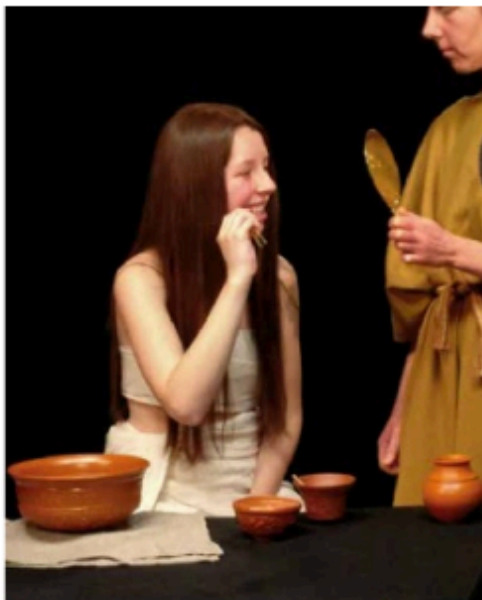
Een vrouw maakt haar tanden schoon.

Bij een verzorgd uiterlijk hoort een mooi gebit. Dat is nu zo en dat was in de Romeinse Tijd niet anders. Zowel mannen als vrouwen werden geacht hun tanden schoon en hun adem fris te houden: