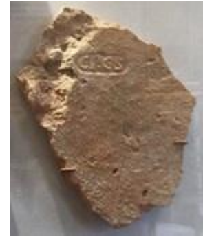
Stuk bouwmetaal met het stempel CPCS

Het is gissen naar wie zij precies was, maar de passage geeft wel mooi aan dat vrouwen van de Romeinse elite hun eigen vermogen konden hebben. Tussen neus en lippen geven de brieven nog meer details en informatie over het rijkere Romeinse leven eind eerste, begin tweede eeuw, die de brieven tot aangename lectuur maken. Terwijl hier rijke gepensioneerden in de winter de zon opzoeken, overzomerde de rijke oudere Romein in koelere, bergachtige streken als Umbrië. ‘En ’s zomers is het heerlijk mild. [...] Vandaar ook de vele ouderen hier. Je ziet er grootvaders en overgrootvaders van mensen die zelf al volwassen zijn, je hoort er verhalen van vroeger, gesprekken als in tijden van weleer. Wie hier aankomt voelt zich kind van een ander eeuw.’