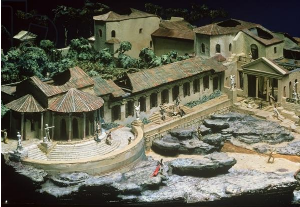
Model van de villa bij Laurentum, model door Clifford Pember, Ashmolean Museum Oxford

vijgenbomen. Ook is er een halfondergrondse porticus, waar het zowel in de zomer als de winter goed toeven is. Tot slot heeft Plinius een paviljoen laten aanleggen met een zonnekamer die uitzicht biedt op zowel de zee als de tuin, en bos en bergen. Hier heeft hij ook een ‘geluidsdichte’ slaapkamer, waar hij zich bij feesten ongestoord kan terugtrekken. Stromend water ontbreekt, maar rondom zijn genoeg waterbronnen. Iets verderop is ook nog een dorp met huurbadhuizen: die komen van pas als hij maar kort in zijn villa verblijft en het geen zin heeft om de eigen stookinstallatie aan te steken. Dat gebeurt nogal eens, want de villa is zo dichtbij dat hij na een werkdag vaak nog even te paard – in verband met een zandpad naar de villa is die manier van reizen comfortabeler dan in een tweespan – een