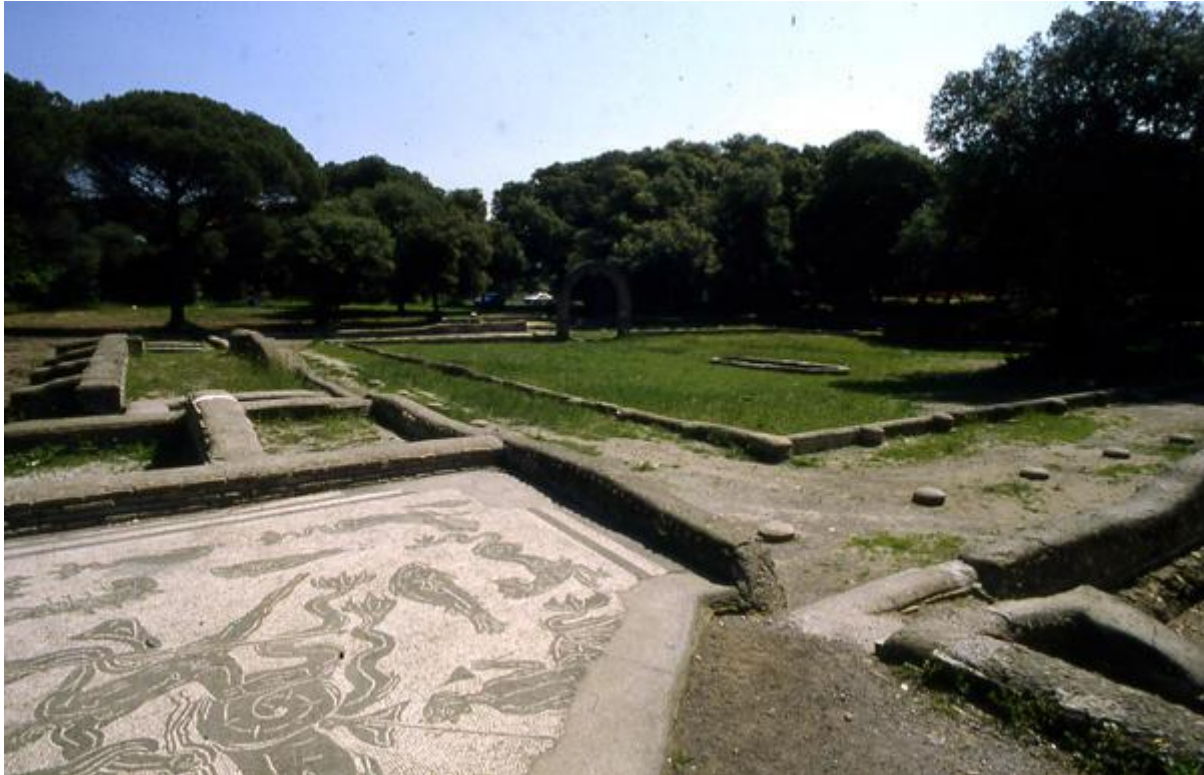
De zogenaamde iVilla di Plinio bij Castel Fusano

hij in ieder geval weten dat hij aan beide villa's 'wat ontbreekt' laat aanbouwen. Dat zal wel luxe zijn zoals een eigen badvoorziening die ooit tijdens de bouw nog niet 'normaal' was, maar waar een rijke Romein uit Plinius' tijd al niet meer zonder kan. Het doet me denken aan hoe nu oude huizen in gewilde buurten gestript worden om aan de moderne wooneisen te voldoen en voorzien worden van inbouwkeukens en luxe badkamers. In en om Como, waar van bovenaf in het centrum nog het oude Romeinse stratenpatroon is te zien, is het overigens vergeefs zoeken naar bordjes die de weg wijzen naar de restanten van de 'Villa van Plinius'. Wel heeft het aan het meer gelegen dorpje Corenno in 1863 als eerbewijs Plinio aan zijn plaatsnaam laten toevoegen. En er zijn luxe vakantieonderkomens die zich Villa Plinio of Villa Pliniana noemen.