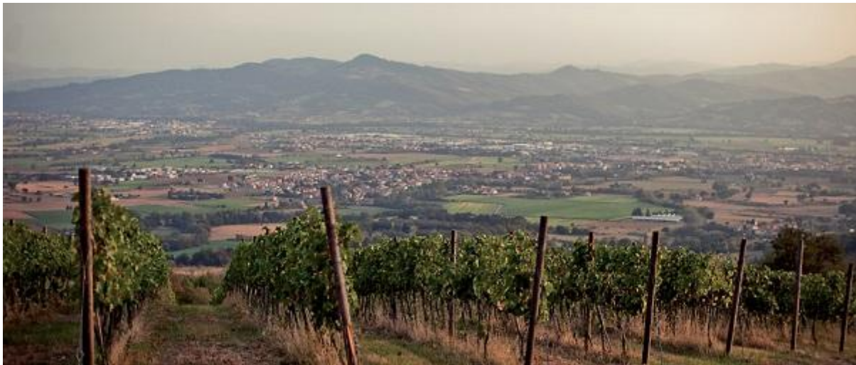
© | De streek La Palerna, waar de Umbrische villa van Plinius heeft gestaan

Soprintendenza van Umbrië, de universiteit van Perugia en de universiteit van Alicante) zijn resten gevonden van een groot villacomplex. De eerste fase dateert uit de derde en tweede eeuw voor Christus, dus de Etruskische tijd; in latere tijden zijn er veranderingen en uitbreidingen geweest. De belangrijkste reden om aan te nemen dat het hier om de villa van Plinius gaat is dat bij resten van een bouwfase uit zijn tijd stempels zijn gevonden met de letters CPCS, de initialen van Plinius. Hunink noemt de vondst in een noot, maar zegt dat de vondsten niet met de beschrijving in de brief lijken te kloppen. In dat verband verwijst hij naar een artikel van de Italiaanse archeoloog Paolo Braconi en zijn Spaanse collega José Uroz Sáez waarin ze zeggen dat de vondsten niet de woongedeelten van Plinius' villa betreffen. Maar dat betekent alleen dat volgens het tweetal het woongedeelte nog niet is gevonden. Op basis van de gevonden stempels gaan ze er wel degelijk van uit dat de gevonden villa die van Plinius is geweest. In de eeuwen na zijn dood zou de villa nog een paar keer zijn verbouwd.