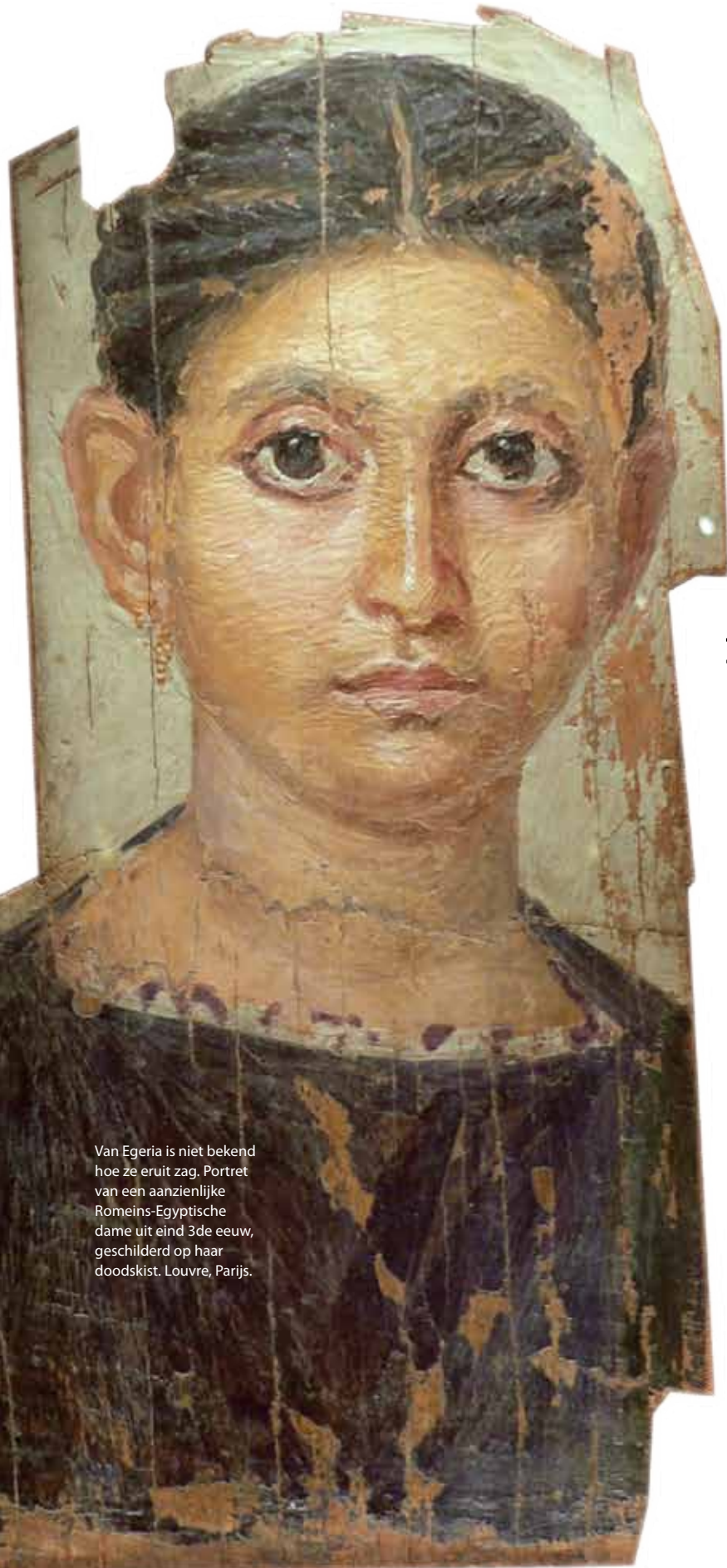
Van Egeria is niet bekend hoe ze eruit zag. Portret van een aanzienlijke Romeins-Egyptische dame uit eind 3de eeuw, geschilderd op haar doodskist. Louvre, Parijs.