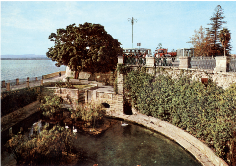
De Arethusabron in Syracuse.

kanten steil aflopend met ruige randen. Hij lijkt in het midden van Sicilië te liggen, vandaar dat sommigen hem 'de navel van Sicilië' noemen. Vlak daarbij liggen gewijde wouden met daaromheen moerassen, en ook een heel grote grot met een spleet in de grond die uitkomt op het noorden. Hierdoor zou volgens de mythe Pluto zijn uitgereden met zijn wagen en Kore hebben geschaakt. De viooltjes en de andere bloemen die de heerlijke geur afgeven blijven vreemd genoeg het hele jaar bloeien, zegt men, en maken dat alles er bloemrijk en aangenaam uitziet.