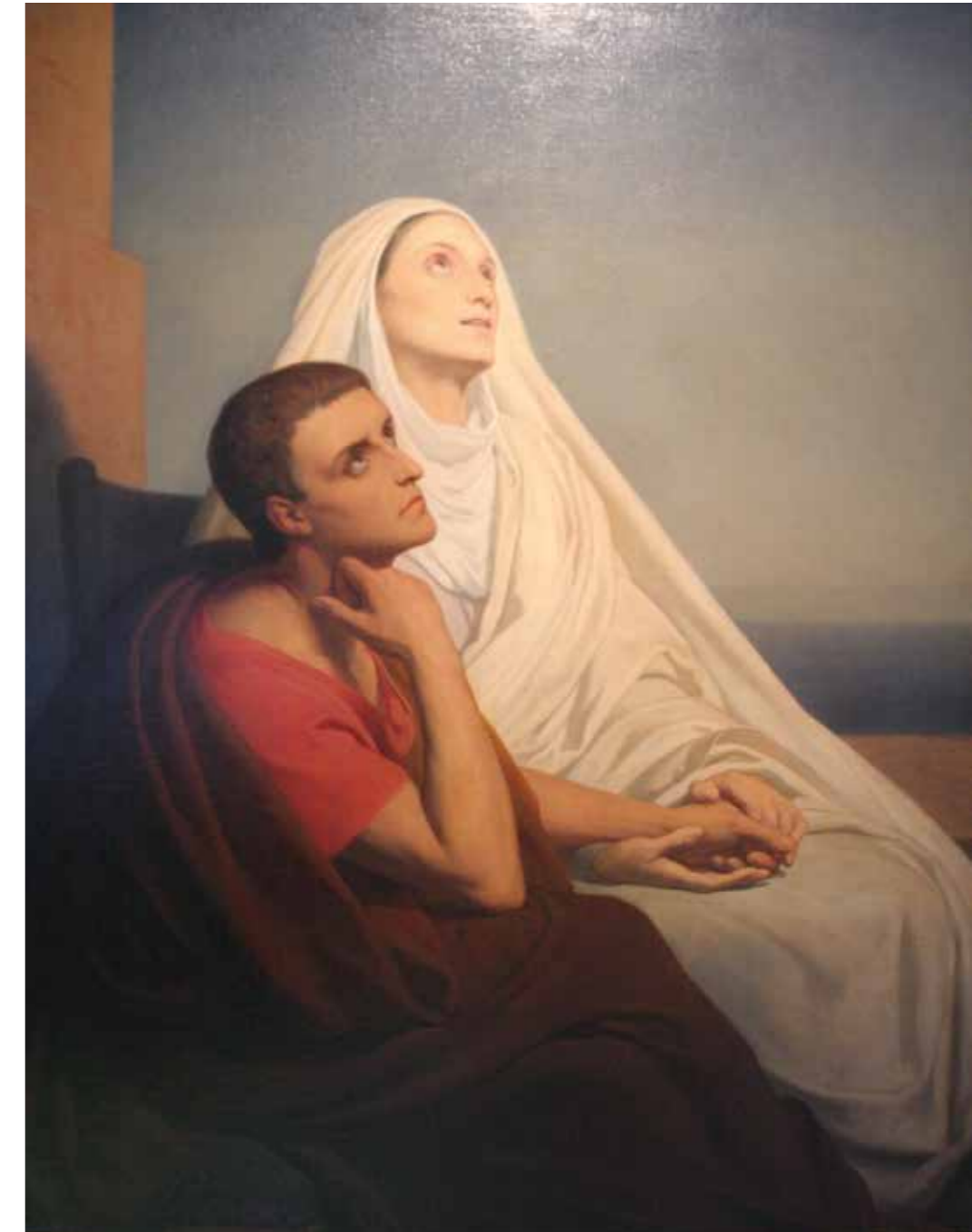
Augustinus en zijn moeder Monica. Schilderij van Ary Scheffer uit 1846 (Dordrechts Museum, Dordrecht).

Het leven van Augustinus door Possidius is in het Latijnse origineel en in Italiaanse vertaling te lezen op www.augustinus.it . In het Nederlands is de tekst onder meer vertaald door Tarcisius van Bavel in Ooit een land van kloosters (...) (Leuven 1999). Een nieuwe vertaling door de auteur van dit artikel is in voorbereiding (publicatie eind 2015). Die zal tevens de complete lijst werken van Augustinus ( Indiculus ) bevatten, zoals opgetekend door Possidius.