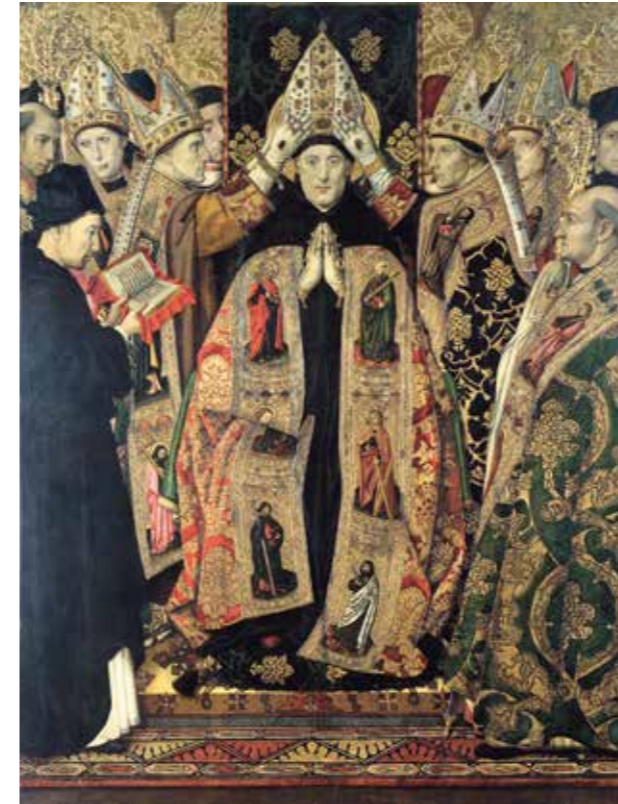
Augustinus wordt tot bisschop gewijd. Tempera, stuc en bladgoud op hout van Jaume Huguet uit ca. 1463-1470 (Museo Nacional d'Art de Catalunya, Barcelona).