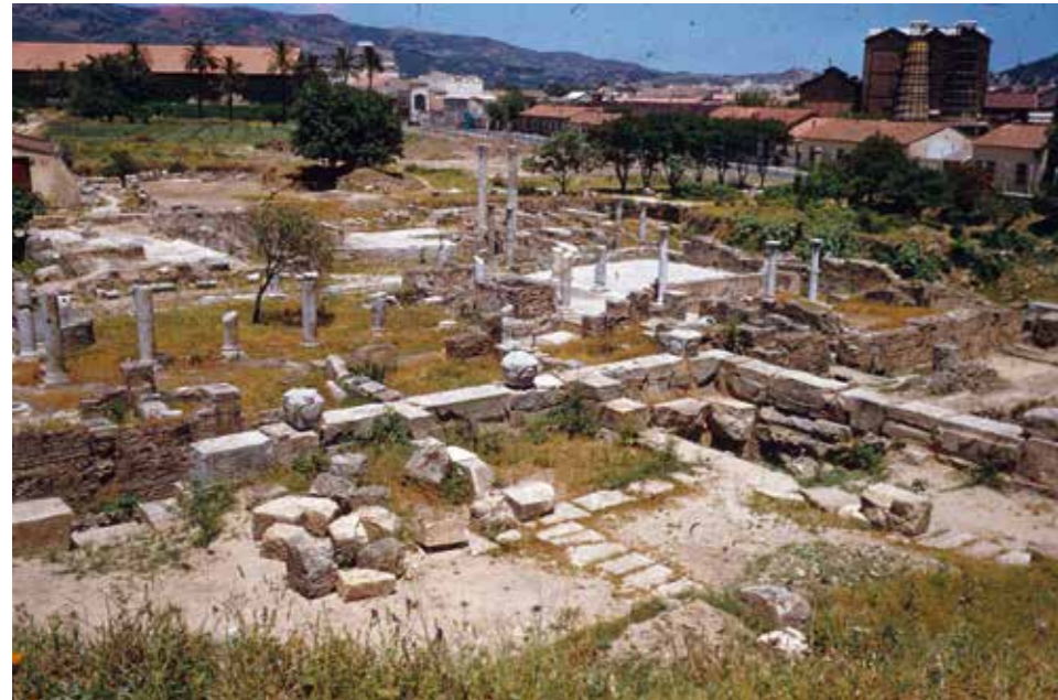
Restanten van een villa in Hippo Regius (Algerije) (Foto: R.V.Schoder, Loyola University of Chicago).

was het goed en had hij zijn broeder gewonnen. Lukte dat niet, dan moest hij een of twee man erbij halen, en als de ander die ook niet serieus nam, de hele gemeente. Wilde hij dan nog niet luisteren, dan moest zo iemand gelden als een heiden of tollenaar.