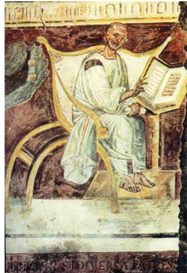
Het oudste portret van Augustinus, op een 6 de -eeuws fresco in een ruimte onder de Sancta Sanctorum (Scala Sancta) in Rome.

de toeschouwer met een indringende blik aan: het is of hij aandachtig luistert. In het themanummer 'Augustinus' van Hermeneus (74, 2002, 65-216) bespreekt Fred Verstappen o.s.a. dit portret.